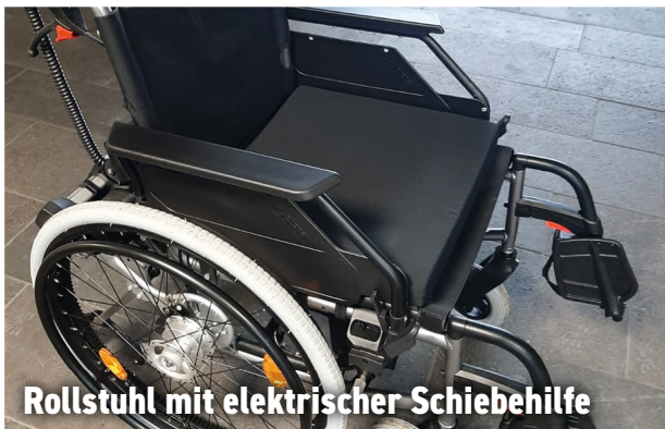
Rollstuhl mit elektrischer Schiebehilfe