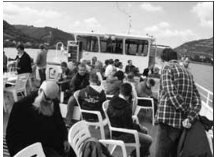
Eine Schiffstour auf dem Rhein hat viel zu bieten. Die Messdiener und ihre Begleiter genossen den Tag.