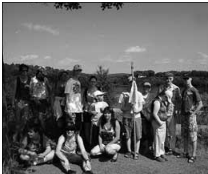
Unter blauem Sommerhimmel wanderte die Gruppe mit dem „Bolivien-Pilgerstab“ rund um das Weinfelder Maar.

Dann ging es weiter zum Schalkenmehrener Maar, wo sich die Gruppe auf einer Wiese beim Picknick im Schatten der Bäume ausruhen konnte. Manche spielten zusammen Frisbee, mit dem Ball oder dem Schwungtuch, Ehre Gottes und als Zeichen für ihre Gemeinschaft sangen alle gemeinsam wieder schöne Lieder.