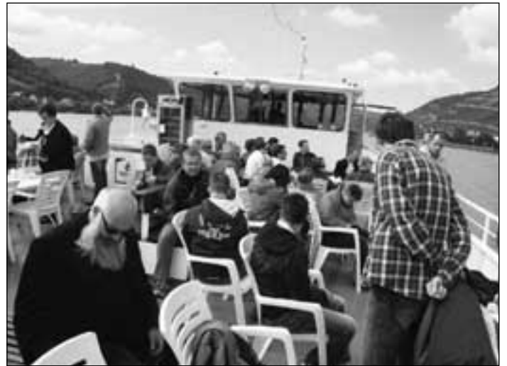
Eine Schiffstour auf dem Rhein hat viel zu bieten. Die Messdiener und ihre Begleiter genossen den Tag.