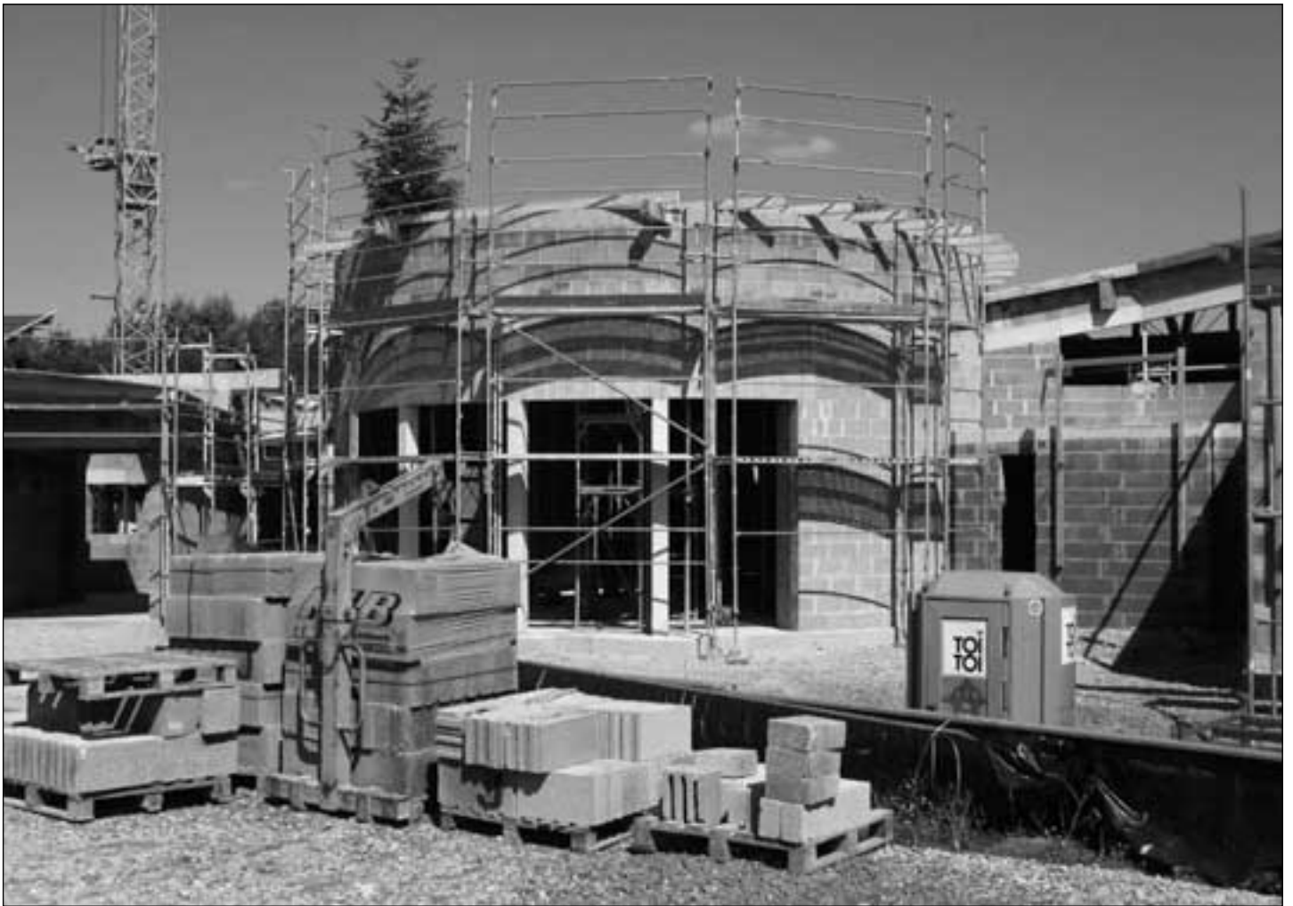
Der Rohbau des Hauses für Kind und Familie wächst. Im nächsten Sommer wird Einweihung gefeiert.